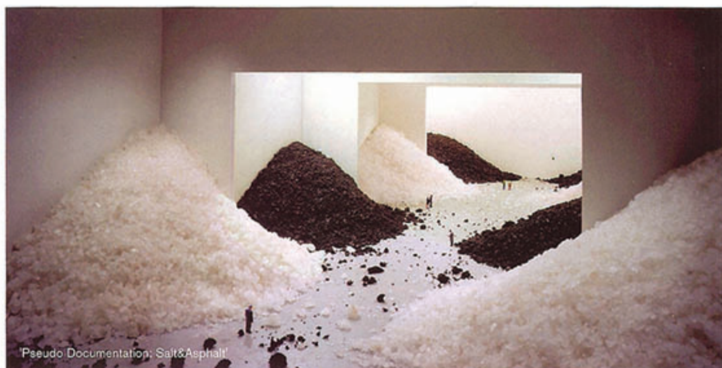
'Pseudo Documentation: Salt & Asphalt'

da arquitectura e do espaço. A ideia para o desenvolvimento deste projecto nasceu da documentação fotográfica das suas obras e da reflexão sobre a arte documental fotográfica. Numa alusão à grandiosidade de espaços de exibição de arte contemporânea como o Dia Beacon ou o Tate Modern, as suas imagens expressam o interesse nas formas e na história da abstracção modernista e a sua paixão pela arquitectura das galerias e museus monumentais.