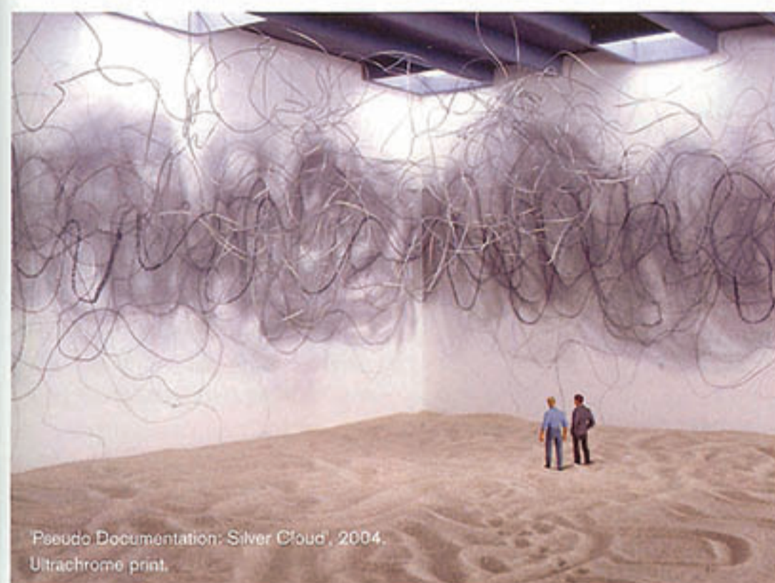
'Pseudo Documentation: Silver Cloud', 2004. Ultrachrome print.

The process included the creation of three-dimensional models at the exhibition sites with the artistic pieces placed inside them, creating an illusionary vision